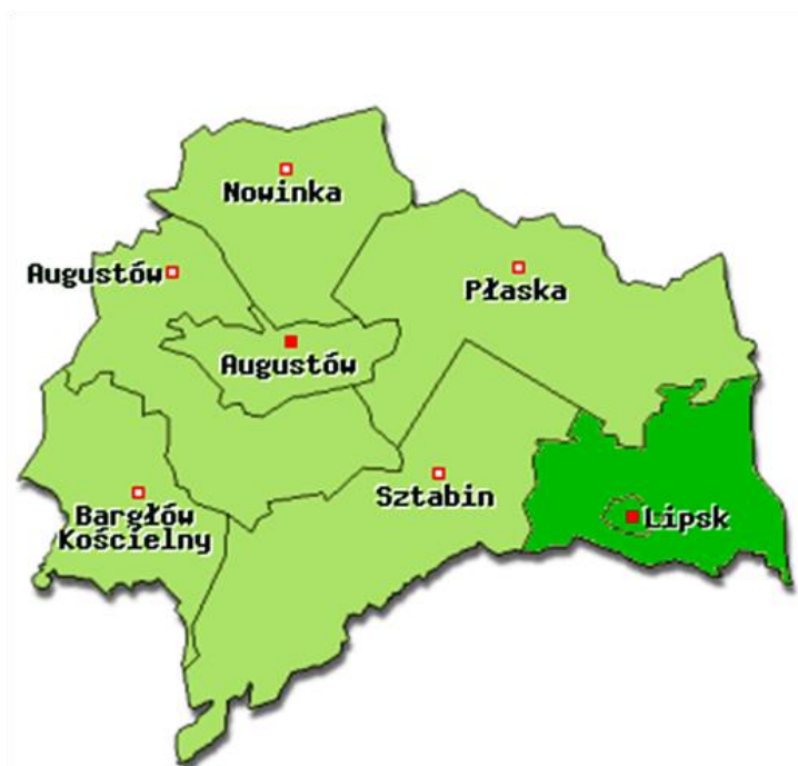
Rysunek 1. Gmina Lipsk na tle powiatu augustowskiego

W oparciu wykorzystano mapy cyfrowe IMAGIS